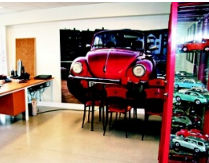
moderne, funksjonelt og friskt, og ikke minst personleg.