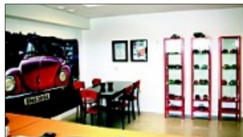
RAUDT: Bobla og raudfargen gjer heile interiøret.