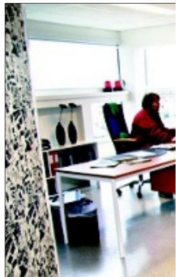
ETTER: Med ansiktsløftinga framstår kontoret som