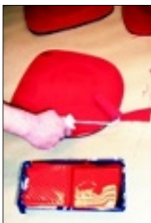
MÅLING: Stolseta vart demonterte, pussa, grunna og måla med høgglassmåling.

Totalprisen på det nye kontoret vart om lag 10.000 kroner. Det inkluderar fototapet, glasskáp, hylle, punt/interiøartiklar, bilderammer, måling, sparkel m.m. Arbeidet er ikkje inkludert i prisen.