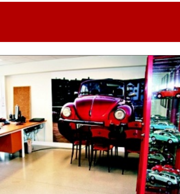
moderne, funksjonelt og friskt, og ikke minst personleg.